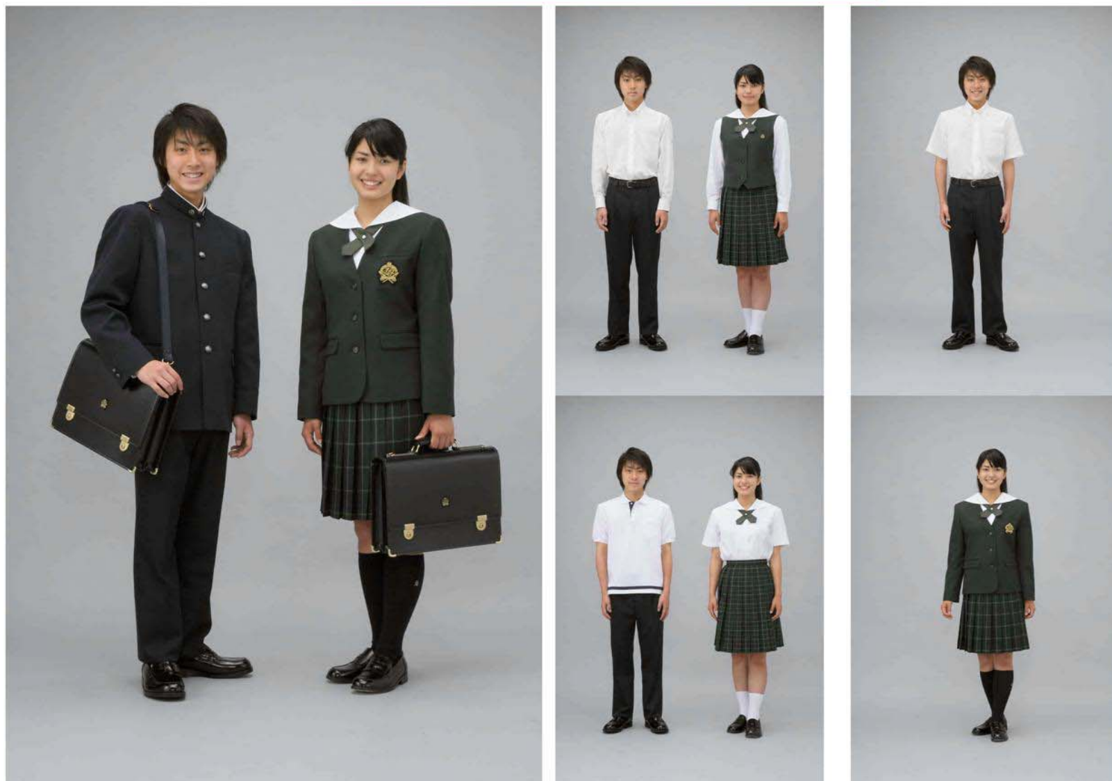
山本寛齋デザイン おしゃれで可愛いですね。着心地も良いし。男子の紫も素敵ですね。 [モデルさんのコメント]